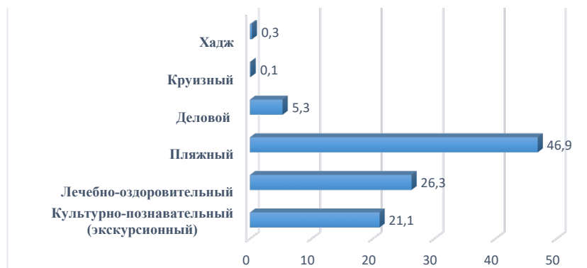
Рисунок 1 – Портрет казахстанского туриста в сегменте выездного туризма

Исследование выявило, что в 2021 году туристы стали чаще выбирать туры в бюджетном сегменте, что говорит о значительном снижении покупательской способности в связи с мировым кризисом. Из общего числа 5,3 % респондентов заявили о полном отсутствии туристов в сегменте выездного туризма, что скорее всего отражает положение небольших компаний либо компаний, которые начали работать на рынке не так давно [18].