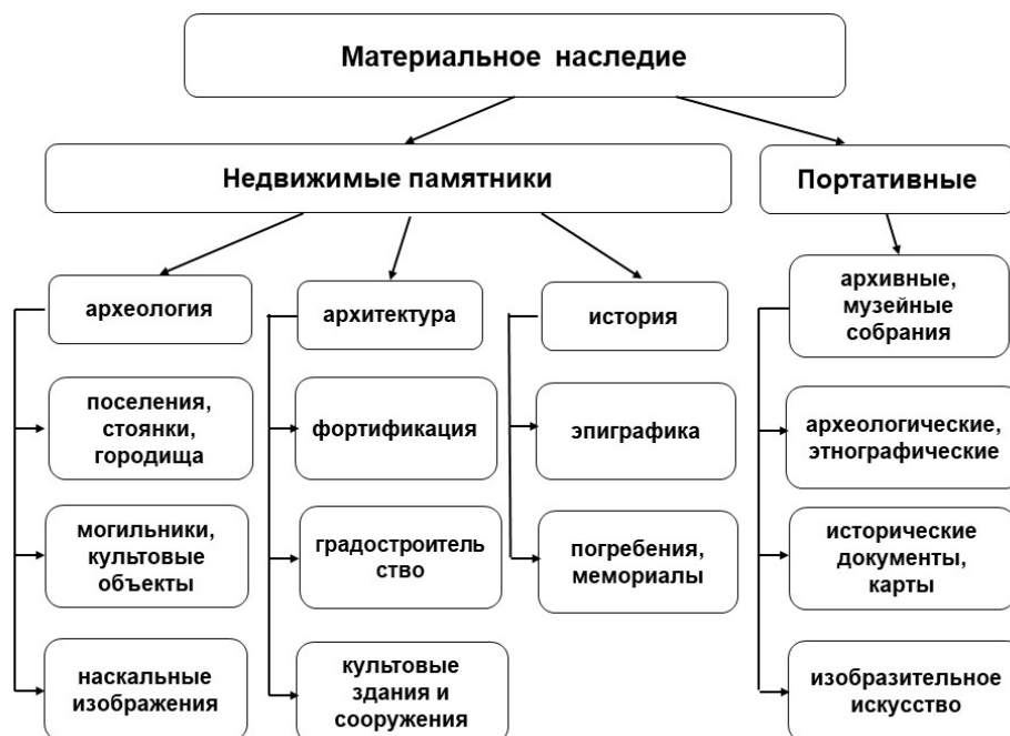
Рисунок 1 – Общая структура материального наследия [6, с. 63]

Как видно из приведенной схемы, практически все памятники материального культурного наследия, представленные, в частности, в Казахстане, можно подразделить на недвижимые и портативные, или движимые, памятники. К недвижимым относятся археологические (стоянки, поселения, городища), архитектурные (военные укрепления, градостроительство, культовые здания), исторические (погребения, мемориалы, древние надписи). В свою очередь, к портативным, или движимым, относятся архивные и музейные собрания, в том числе археологические, этнографические экспонаты, документы, карты, предметы изобразительного искусства и т.д. Документальные памятники – это акты органов государственной власти и государственного управления, другие письменные и графические документы, кино-, фотодокументы и звукозаписи, древние и другие рукописи и архивы, записи фольклора и музыки, раритетные книги [7, с. 156].