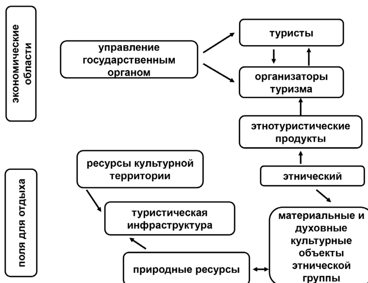
Рисунок 2 – Система создания этнотуристских продуктов