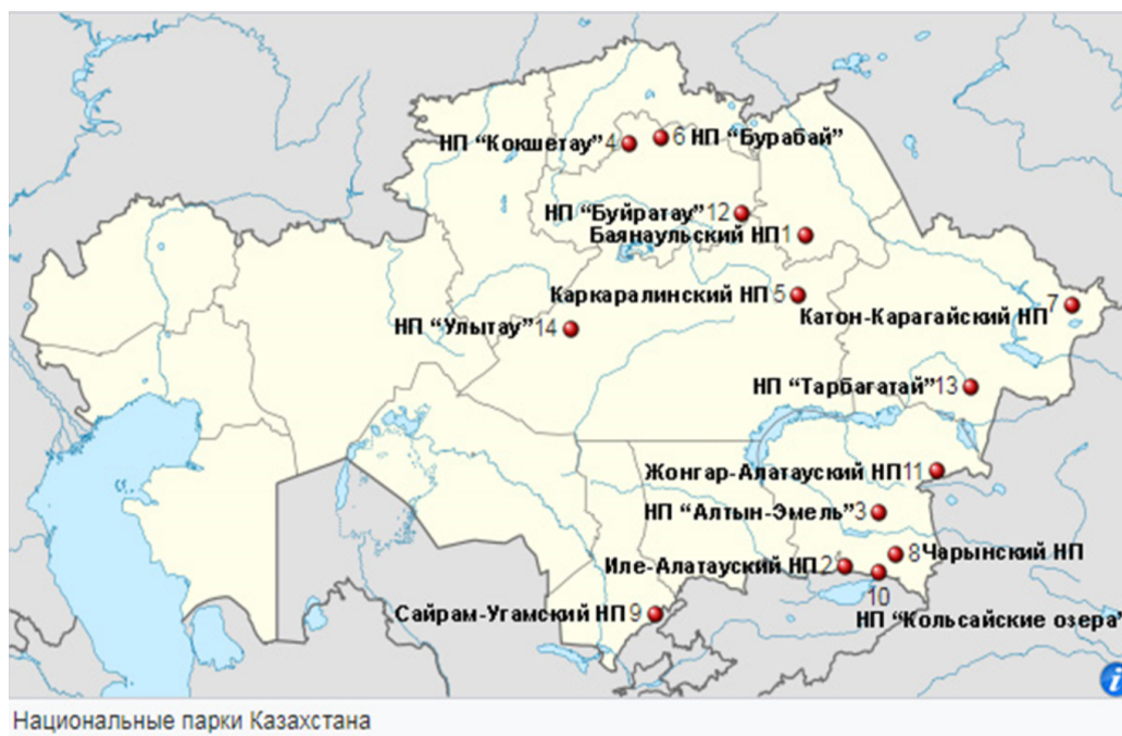
Рисунок 3 – Национальные парки Казахстана [10]

В настоящее время общая площадь вышеуказанных национальных парков Казахстана на охраняемых природных территориях составляет около 3 млн гектаров, около 9 % площади страны. Красота пейзажей и ландшафтов, неповторимость и уникальность национальных природных парков Казахстана представляют особую историческую, эколого-географическую ценность, природное и культурное наследие для будущего поколения, охраны окружающей среды, эффек-