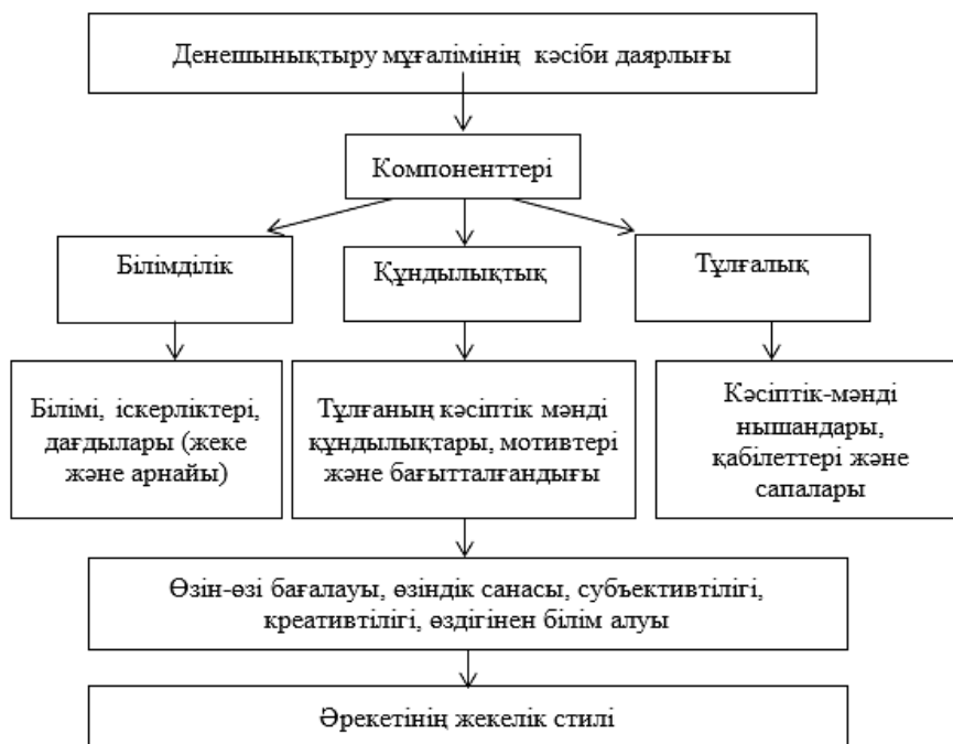
1-сурет – Болашақ денешынықтыру мұғалімінің кәсіби даярлығының құрылымы

Төменде болашақ денешынықтыру мұғалімінің кәсіби даярлығының құрылымы берілді (1-сурет).