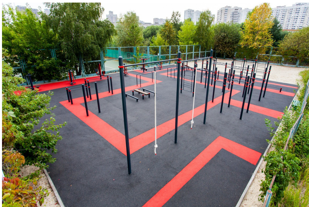
Рисунок 4 – Многопрофильный комплекс снарядов «Воркаут»

жительства в г. Алматы после реализации социального проекта «Спорт в моем дворе» в 2017-2018 гг. позволило существенно увеличить интерес алмаатинцев к занятиям физической культурой и массовыми видами спорта (рисунки 4, 5).