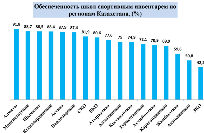
Рисунок 2 – Обеспеченность школ спортивным инвентарем по регионам, Казахстан, %

– приобретать варианты социальной практики, работы в социуме и др.