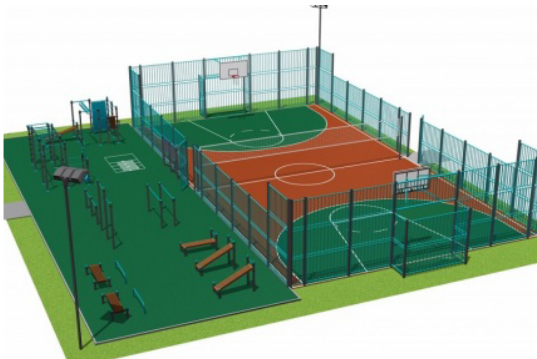
Рисунок 5 – Спортивная игровая площадка с комплексом тренажеров

Специалистами Российской Федерации Мяконьковым В.Б., Росенко С.И. разработаны практические рекомендации по организации занятий физической культурой и массовым спортом в зависимости от развития инфраструктуры: