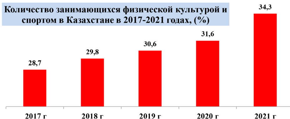
Рисунок 1 – Количество занимающихся физической культурой и спортом в Казахстане в 2017-2021 гг., %

Количество занимающихся физической культурой и спортом в Казахстане в 2019 году составило 5,7 млн человек, или 30,6% от всего населения, а в 2020 году увеличилось до 5,9 млн человек (31,6%) в 2021 году количество занимающихся увеличилось до 6,5 млн человек (34,3%) (рисунок 1).