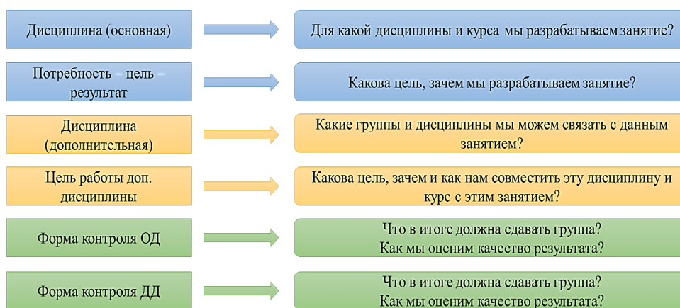
Рисунок 3 – Пример построения креативного, творческого и/или внеаудиторного занятия

Методика организации креативных занятий по ОП «Туризм» может быть представлена различными способами в зависимости от целей, видов и форм этих занятий. На рисунке 3 сформирован один из подходов к осмыслению данной методики и ее применению в условиях туристского образования.