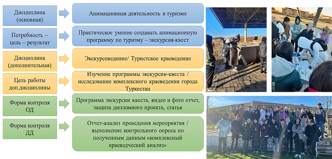
Рисунок 4 – Пример планирования и реализации креативного занятия по дисциплине «Анимационная деятельность в туризме»

Именно через креативное занятие обучающиеся второго курса получают уникальную возможность увидеть результат профессионального обучения выпускного курса, а также реализовать свои цели: