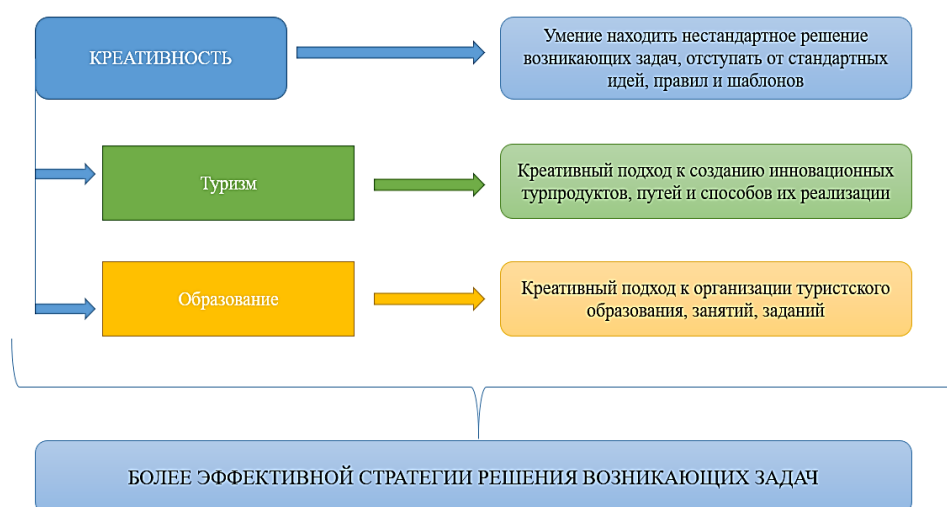
Рисунок 1 – Понятие «креативность» в туризме и образовании

Креативный туризм – это постоянный поиск эффективных методов подготовки и повышения специалистов для индустрии туризма, а именно формирование нестандартных подходов к созданию образовательных программ, курсов дисциплин и занятий. Образование традиционно относится к креативным индустриям [6], а туристское образование является частью креативного туризма.